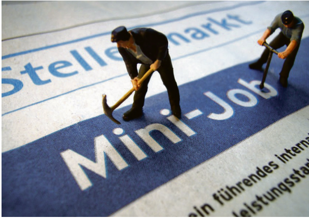
Dårlig betalt: Tysk LO advarer andre EU-land mot såkalte minijobber.