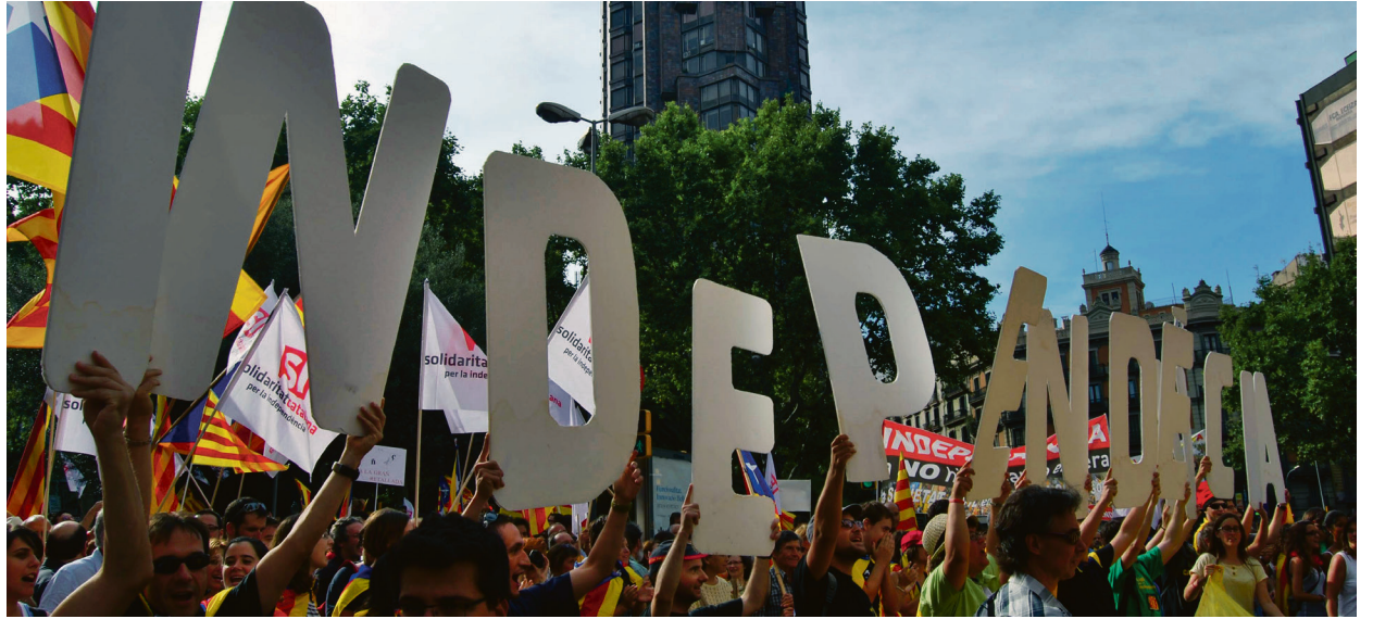
Spent: Situasjonen i Catalonia framstår som uavklart foran nyvalget i desember.