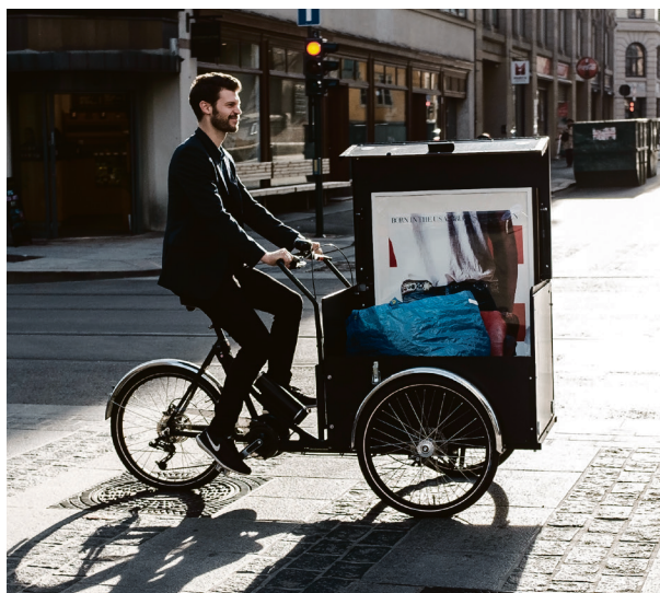
Flyttelass: Slik så det ut da Rødt flyttet inn i nye kontorer på Stortinget.

– Det blir å kjempe gjennom politikk som reduserer de økonomiske forskjellene, slik vi gikk til valg på. Jeg er spesielt opptatt av å få gjort noe med den økende andelen barn som vokser opp i fattigdom. Nå har vi nesten 100 000 barn i