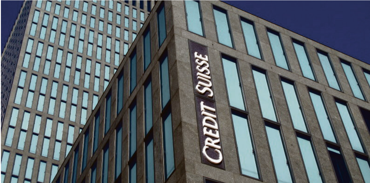
Credit Suisse: Den sveitsiske storbanken Credit Suisse melder om økt konsentrasjon av rikdom.