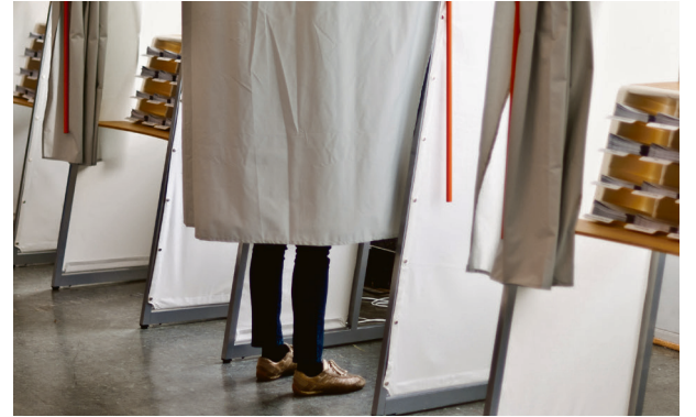
Udemokratisk: Mange folkeavstemninger om kommunesammenslåing var udemokratiske.