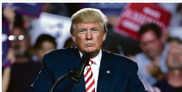
USAs president: Donald Trump.