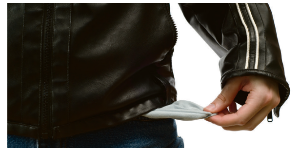
Utsatte grupper: Arbeidssøkende, hjemmevervende, deltidsansatte og studenter er mest utsatt for matusikkerhet.